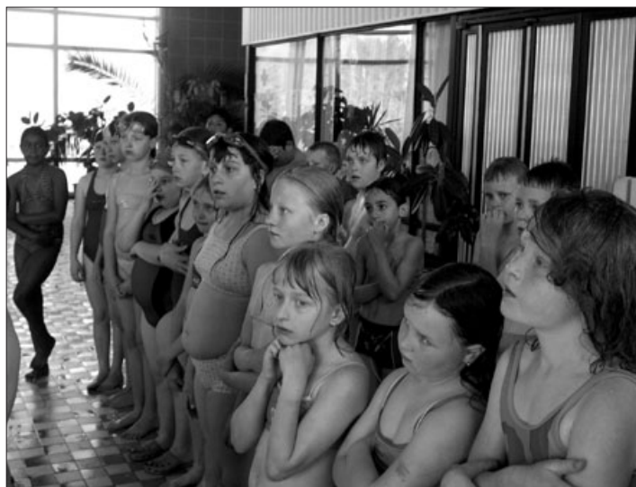
Fotografie z plaveckého kurzu 3. a 4. třídy