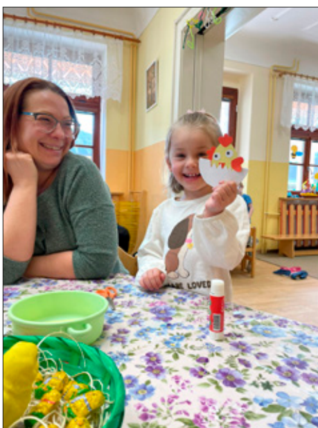
Velikonoční odpoledne s rodiči