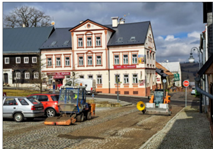
Jarní úklid místních komunikací technikou obce