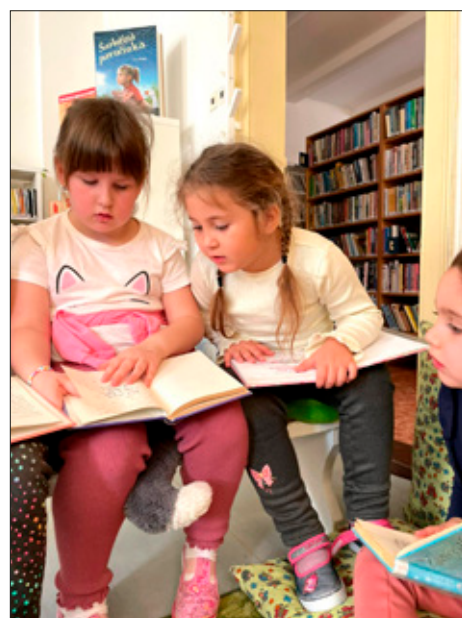
Pravidelná návštěva v knihovně