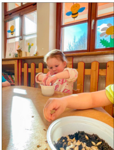
Setí osení – příprava na velikonoční svátky