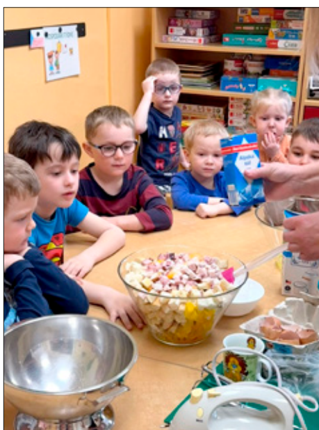
Pečení velikonoční nádivky